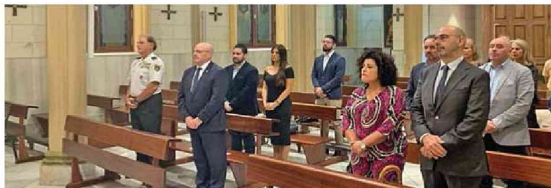
Tras el descubrimiento de la placa se celebró una misa en la Iglesia Castrense en honor a la patrona del Ilustre Colegio de Abogados, Santa Teresa de Jesús